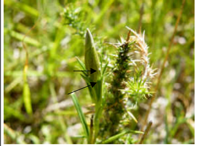
Figure 4 : pontes sur fleur non éclos