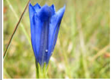
Figure 3 : pontes sur la fleur de Gentiane

La station de ponte trouvée sur le CTPEC est actuellement (août 2011) la seule connue dans les Landes, elle se trouve sur la commune de Callen.