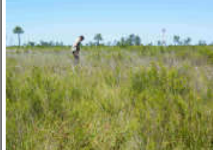
Figure 2 : aspect de la station

Localisation : la station se trouve immédiatement à l'ouest des bassins situés au sud de la C20 (voir carte).