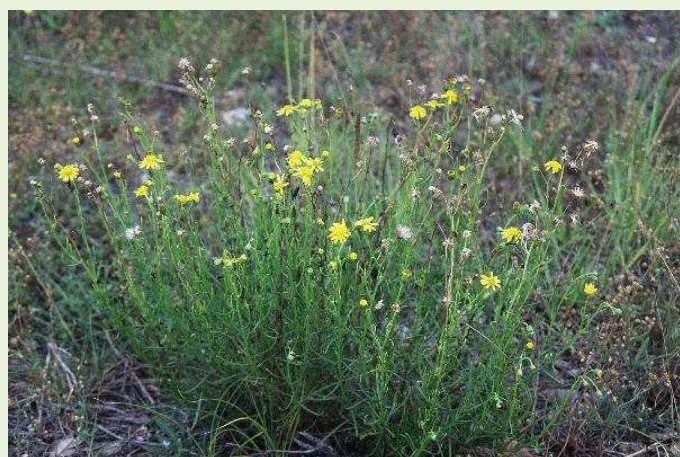
Vue d'ensemble d'un bouquet

Opérations menées sur le littoral par l'ONF : http://dune-littorale-aquitaine.n2000.fr/node/132 Fiche du CBN de Brest, pédagogique et claire http://www.cbnbrest.fr/site/pdf/senecon.pdf