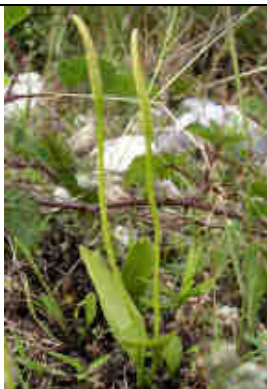
Figure 3 : idem, 7/6/2007