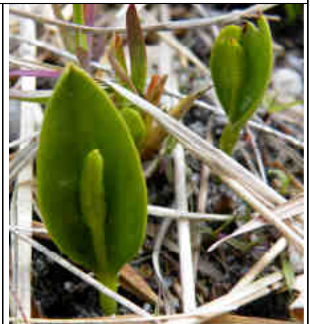
Figure 2 : Sur la station, 28/4/2009

Présentation - Ophioglosse des Açores ( Ophioglossum azoricum C. Presl.) : cette petite plante associée à la famille des fougères, compte quelques rares stations en France. A la base vie, ce sont près de 5000 pieds qui ont été notés par le conservatoire botanique, soit 25% de la population Aquitaine. Dans le camp, une quarantaine de pieds ont été observés, mais il est probable qu'elle soit présente ailleurs. Elle fleurit (voir photo) à partir du mois d'avril en général. Elle peut être confondue avec l'Ophioglosse vulgaire, assez rare mais qui n'est pas protégée. La plante fait sa « phase végétative » aérienne puis disparaît vers le mois de juin ; mais ses rhizomes (racines souterraines) restent sous terre, et lui permettent l'année suivante de produire de nouvelles fructifications. Pour cette raison, le travail du sol est à proscrire, il risque de détruire ces rhizomes.